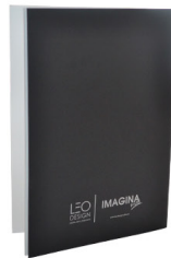
Cuaderno Ideas / s/.6.00