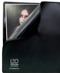
Portafolio de Trabajo / s/. 70.00