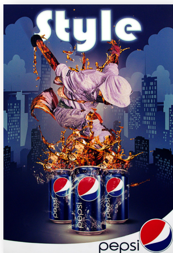
José Meneses / Ilustración Publicitaria