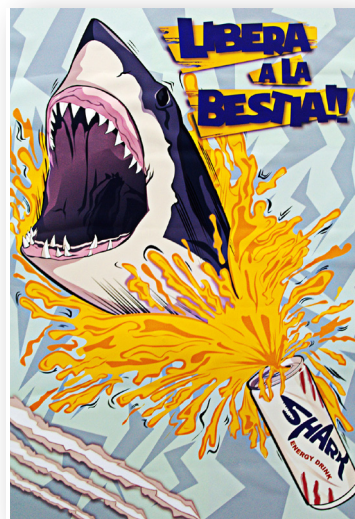
Cesar Blanco / Ilustración Publicitaria