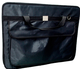
Maletín Publicitario / s/. 65.00

Nuestro merchandising diseñado especialmente para tí: