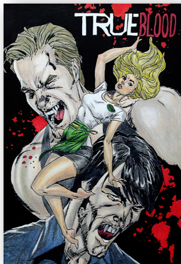
Pedro Campos / Dibujo Artístico