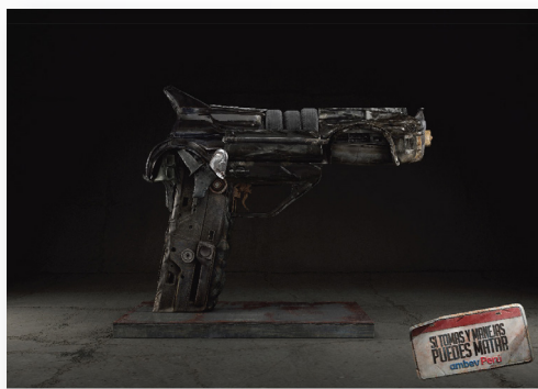
TOMAR BEBIDAS ALCOHÓLICAS EN EXCESO ES DAÑINO

En una de las esquinas del concurrido Parque Kennedy de Miraflores, Ambev Perú de la mano de la agencia JWT, instalaron una pistola gigante, hecha a base de restos de un auto siniestrado. Esta escultura busca concientizar a todos los conductores, sobre el peligro de manejar en estado de ebriedad. La novedosa implementación busca generar impacto y concientización, bajo el mensaje: "El vehículo puede ser un arma, en caso se maneje bajo los efectos del alcohol", se retrata lo que puede suceder si se rompen las reglas de manejar en estado etílico.