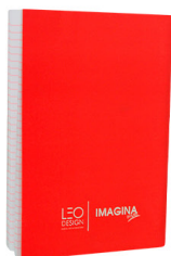
Cuaderno Bocetos / s/. 5.00