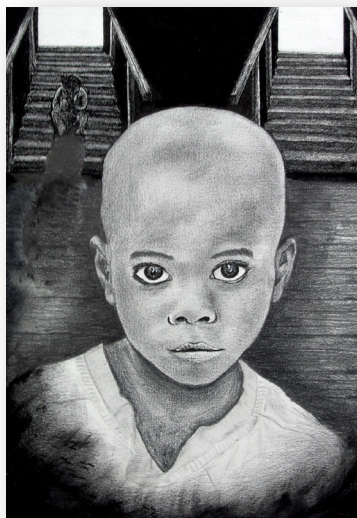
Nino Marcelo / Dibujo Artístico