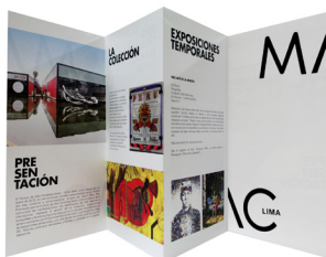
"MUSEO DE ARTE CONTEMPORÁNEO"

Un cómodo y tranquilo ambiente en el que podrás investigar, leer o hacer uso de una computadora con acceso a internet.