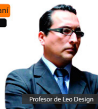
Profesor de Leo Design