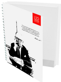
Cuaderno Académico / s/.25.00