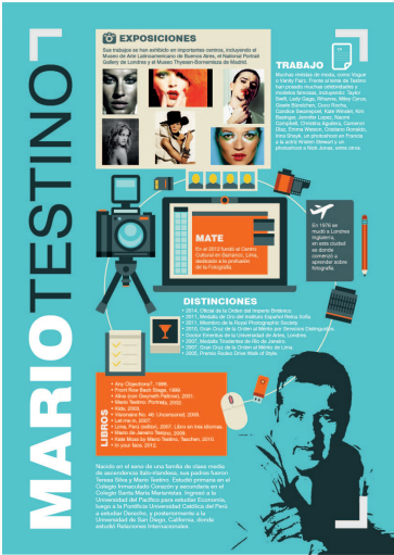
- Illustrator - Alondra León