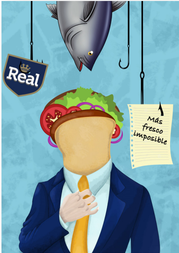
- Ilustración Publicitaria - Alexander Castro